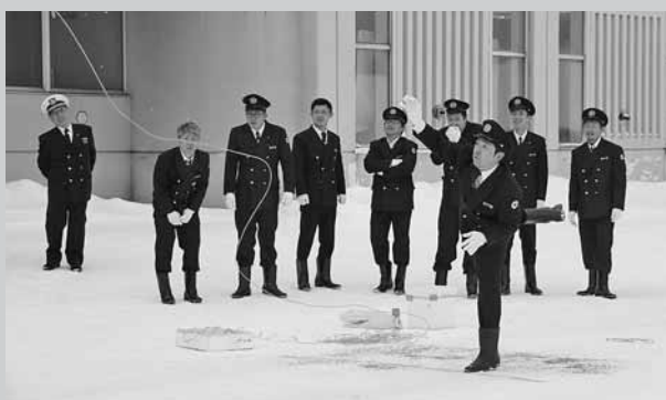
▲投縄投法訓練を行う増毛救難所の所員

その後に行われた交礼式では、林所長が「所員一同、救難所の使命を理解し本日決意を忘れることなく海難事故防止に努めていきたい」と式辞を述べました。