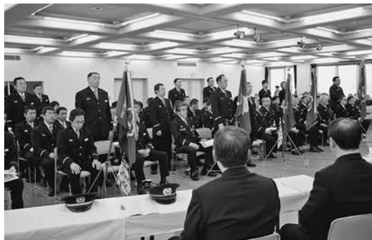
▲文化センター中ホールにて表彰式