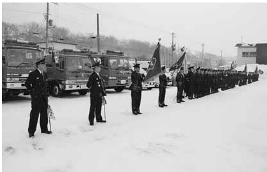
▲文化センター前駐車場で整列

平成31年1月5日(土)消防出初式を挙りました。出初式に先立ち、増毛町厳島神社で今年の無火災・無災害を祈願しました。その後、文化センターで堀町長や来賓の方々の観閲を受けた後、表彰式を行いました。