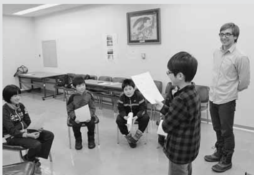
▲アンドリュウ先生と英語を楽しむ参加児童

町教育委員会主催で、小学生が放課後にALT（外国語指導助手）と英語を親しむ「増毛英語塾（後編）」が1月23日に開講しました。