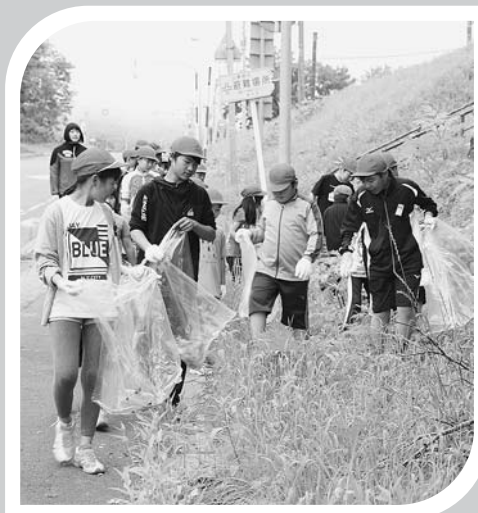
◀増毛小学校クリーン作戦（7月11日町内）