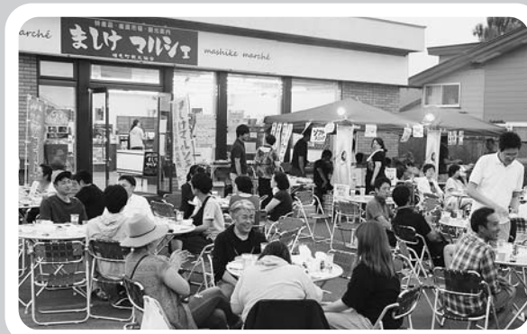
▼ましけマルシェ夏祭り（7月20日ましけマルシェ）