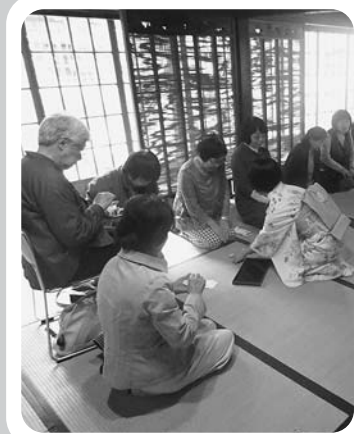
◀旧商家丸一本間家 茶菓サービスの日 （7月7・8日旧商家丸一本間家）