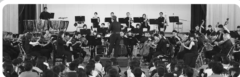
▲増毛小学校芸術鑑賞会 東京フィルハーモニー交響楽団（7月10日増毛小学校）