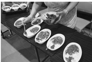
▲ 昨年提供したカレーライス