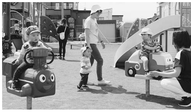
▲第3回親子遊びの広場 外遊び（6月29日保育所）