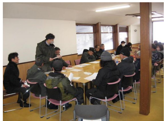
※教育訓練座談会の様子