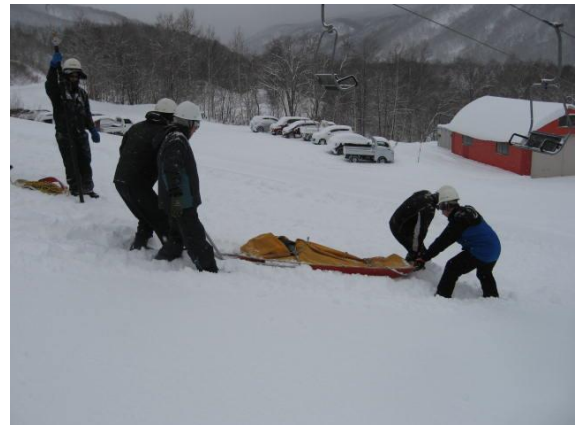
※負傷者の搬送訓練の様子