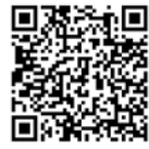
採用試験案内 QRコード