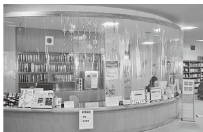
【ロビー感染対策の様子】

なお、来館目的が本の返却のみの方は、自動ドアに入ってすぐのところに返却用の箱を用意しておりますので、感染拡大状況に応じてご活用ください。