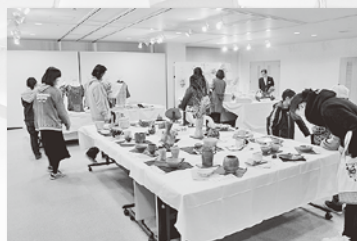
【多目的ギャラリー】

また、1階フリールームは、町民の方が自由に使うことができます。打ち合わせの際などにご活用ください。