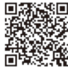
自衛官募集ホームページ QRコード