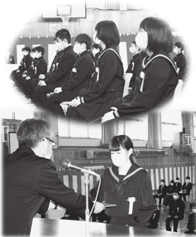
▲増毛小学校 卒業式