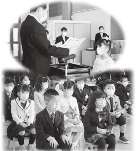
▲認定こども園あつぷる 卒園式