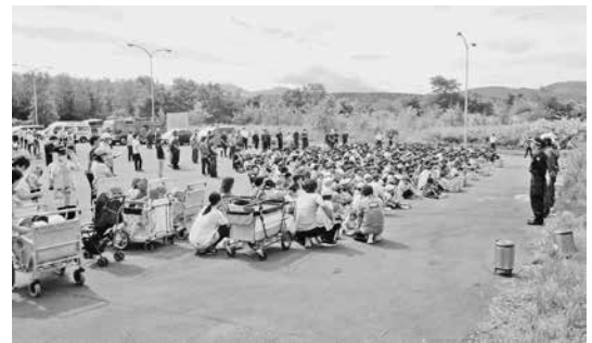
▼昨年の避難訓練風景(見晴駐車場)