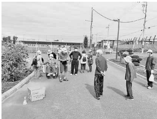
▲昨年の避難訓練風景(増毛中学校)