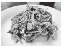
ほうれん草のごま和え 茹でた青菜と和えるだけ！

多く含まれる緑黄色野菜をたくさん食べてほしいです。そこで、手軽に野菜を食べられる方法をご紹介します！材料を全部合わせて混ぜるだけの『ごまだれのもと』を使って、和えるだけ、煮るだけで野菜料理が一品簡単にできます。鍋物のたれ・ドレッシングなどにも応用できます。増毛醤油は減塩率35%なので、今回ご紹介した分量は、従来品（こいくち醤油）を使った場合と比べると、食塩量を3g減らせます。また、カリウムについては従来品の9.5倍含まれており、ナトカリ比が低いのも増毛醤油の特徴です。野菜を食べて、この冬も元気に過ごしてください！