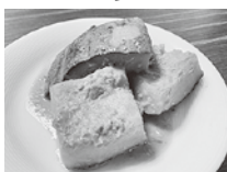
かぼちゃのごま煮 だしとたれで煮るだけ！