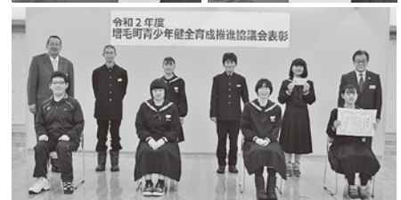
▲優良青少年表彰を受賞した増毛中学校生徒会