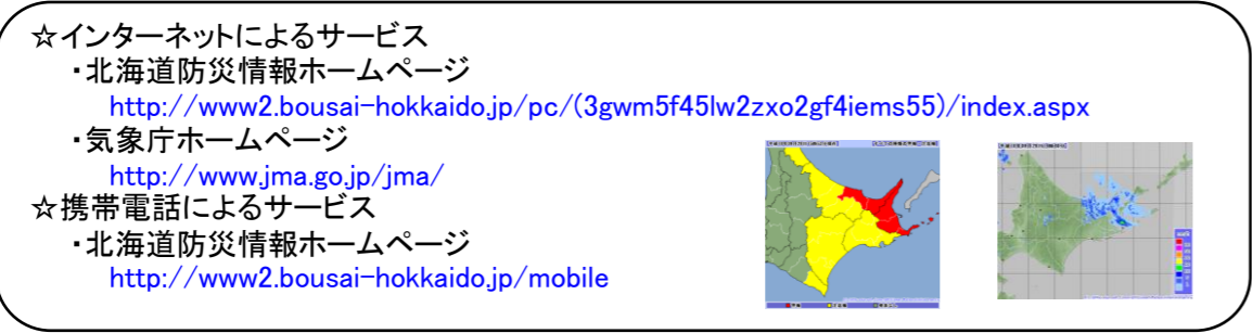
～雨の強さと災害の発生状況～

○まずはテレビやラジオ等で気象情報を確認しましょう。 ○雨が強くなってきたら、電話やインターネットでも確認しましょう