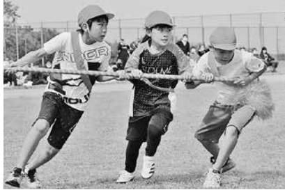
▲コロナをふき飛ばせ!増小ハリケーン