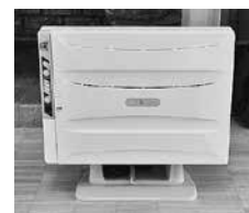
写真左：寄贈された空気清浄機