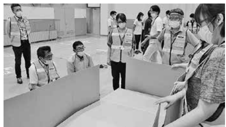
◀避難所運営訓練ダンボールベッドの組立