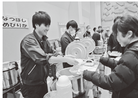
令和元年度増毛町収穫祭の様子