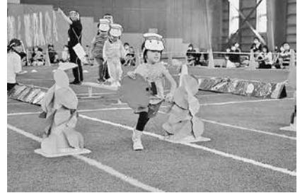
▲マーシーくんのおつかいin増毛町