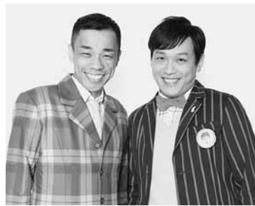
▲“あたりまえ体操”でおなじみの「COWCOW」

おります。この機会にテレビに出演しているお笑い芸人を生で見えて、「笑いの秋」にしてはいかがでしょうか。