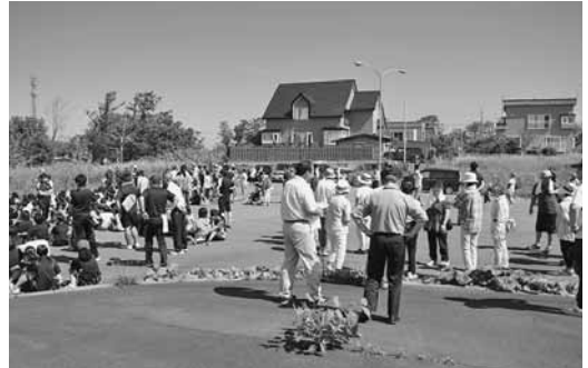
▲▼ 昨年の避難訓練の様子。