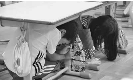
▲地震のときはあわてずにまずは身を守る行動をとりましょう。(シェイクアウト)