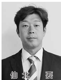
仙北 要 暑寒沢・【応募】