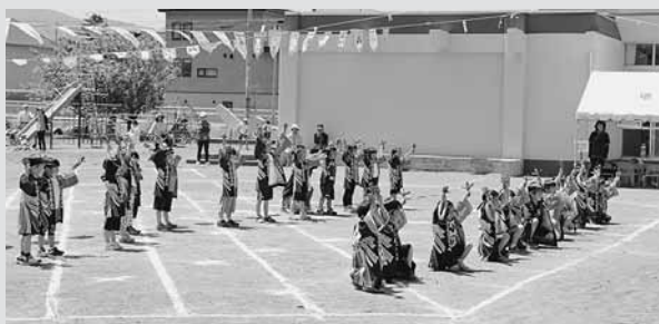
▲ 運動会を締めくくるYOSAKOIソーランの演舞。