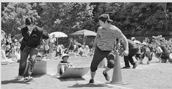
▲ 「落とさず運んで!!親子紅白リレー」では、力が入りすぎて転んでしまう保護者もいました。