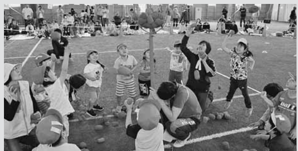
▲ 踊りと玉入れがミックスされた「チェッコリ玉入れ」では、リズムに合わせて玉を投げ入れました。