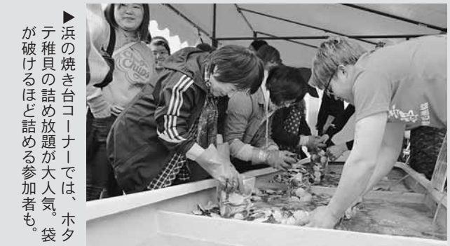
▶浜の焼き台コーナーでは、ホタテ稚貝の詰め放題が大人気。袋が破けるほど詰める参加者も。