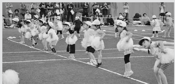
▲ 遊戯「やってみよう」で元気いっぱいにお遊戯を披露