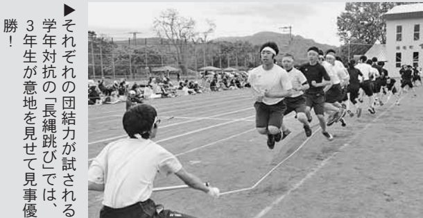
▶ それぞれの団結力が試される学年対抗の「長縄跳び」では、3年生が意地を見せて見事優勝！