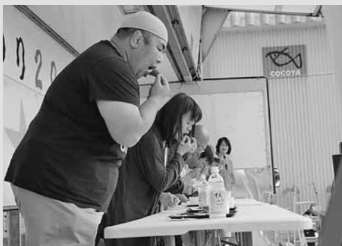
◀「えびの唐揚げ早食い競争」では、他参加者を圧倒するスピードで食べ終わった猛者も。