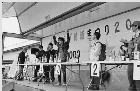
◀千石蔵特設ステージで行われた「国稀利き酒選手権」では、日頃飲み慣れている方でも大苦戦。