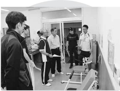
豊富町国民健康保険病院の方々がラサンテに視察に来てくださいました!

この「ゆっくりプログラム」は運動強度が【☆☆☆】と、どの教室よりも高く、普段定期的に運動をしている方でも筋肉に負荷を感じることができ、しっかりと汗をかくことができるトレーニングとなっています。継続的に参加している方からは「通い始めてから体が軽くなった。」「階段を登るときに楽になってきた。」などと効果を実感されている声も聞こえてきます。