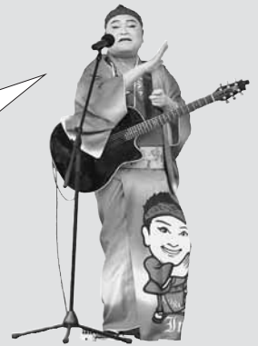
▲今年もちろん登場。大衆ソウルシンガーインディ！「えびの唄 大好きましけ」で会場は盛り上がりました。