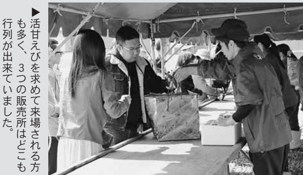
▶活甘えびを求めて来場される方も多く、3つの販売所はどこも行列が出来ていました。