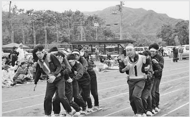
▲ 増毛中学校体育祭名物の「ムカデ競争」。チームみんなで「いち、にー！いち、にー！」と声を合わせてゴールを目指しました。