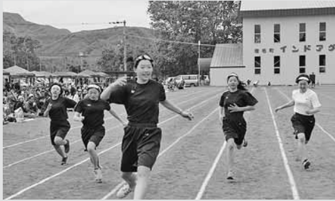
◀ 体育祭の花形「1000M走」の女子決勝の様子。優勝した選手には応援席から大きな拍手がおくられました。