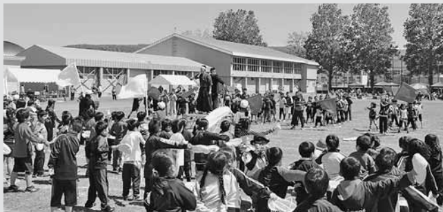
◀ お昼のお弁当で栄養補給した後は、赤組白組の「応援合戦」から午後の部のプログラムがスタート！