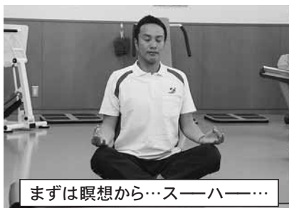
まずは瞑想から…スーハ…