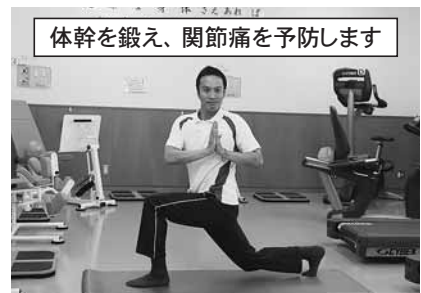
体幹を鍛え、関節痛を予防します