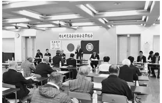
▲5月17日に開催された町交通安全協会の総会では、事業報告の他、交通事故防止への意識を再確認しました。