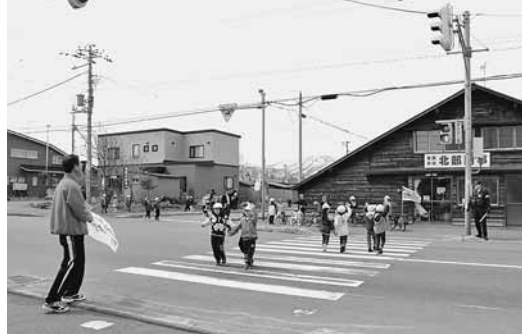
▲増毛小学校の交通安全教室では、実際に外に出て横断歩道の渡り方や自転車での通行ルールなどを学習しました。