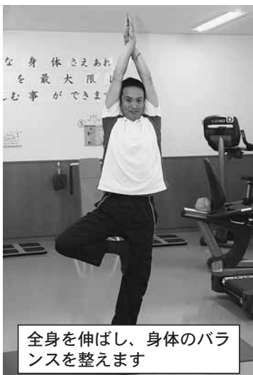
全身を伸ばし、身体のバランスを整えます

運動一番La·sante、健康寿命延伸事業に関する問合せは役場町民課保険年金係(電話53-1113)まで