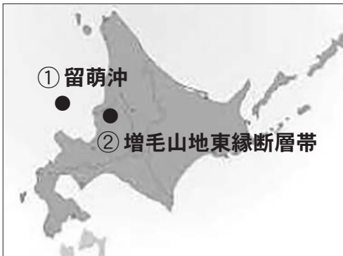
図1 増毛付近で想定される地震

9月6日午前3時7分ごろ、道央を中心に北海道の広い範囲で強い地震があり、胆振管内厚真町で震度7、増毛町でも震度4を観測しました。道内で震度7を観測されたのは初めてで、2016年の熊本地震以来国内で6例目となりました。この地震で厚真町を中心に広い範囲で大規模な土砂崩れが発生したほか、札幌市では液化化現象が発生し、道路が隆起した地域もありました。また、地震により苫東厚真火力発電所をはじめとする北海道内全ての火力発電所が緊急停止した影響で道内全域の約295万戸で一時的停電が発生しました。 増毛町では停電に伴い、一部の地域で断水となり、町職員による給水作業が行われたほか、文化センターで増毛町赤十字奉仕団によるカレーライスやおにぎりの炊き出しが2日間行われました。地震発生から約1日と17時間後に増毛町では停電が解消されましたが、苫東厚真火力発電所の全面復旧時期は10月中旬との見方で、電力供給に不安がある状態が続いていることから今後も道内全域で節電が必要となります。