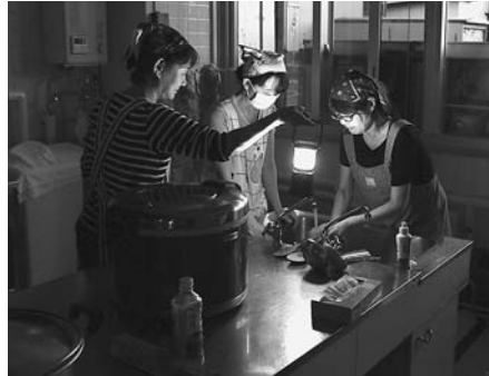
▲停電時の炊き出し状況 (9月6日 文化センター)