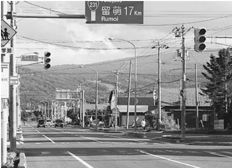
▲停電で信号機が消えた交差点 (9月6日 皇中町3丁目)