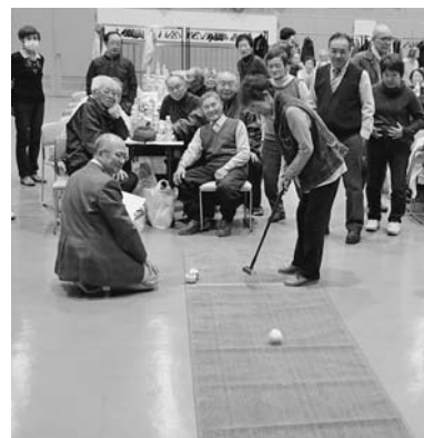
▲昨年の「防犯・交通安全高齢者ふれあい交流会」の様子