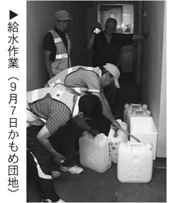
▶給水作業 (9月7日 かもめ団地)