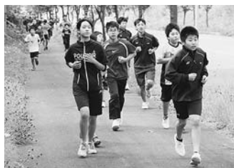
▲避難訓練で走って避難する小中学生

9月3日には、幼稚園、各小中学校による合同避難訓練が実施され、各学校から見晴駐車場まで走って避難を行いました。