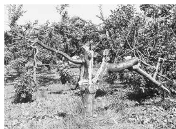
▲台風の強風で折れた果樹の木

台風が過ぎ去ったあとは、風に飛ばされた木の枝などが道路等に散乱していたほか、道路標識が曲がったものもありましたが、5日の午前7時頃に避難者全員が避難所をあとにしました。