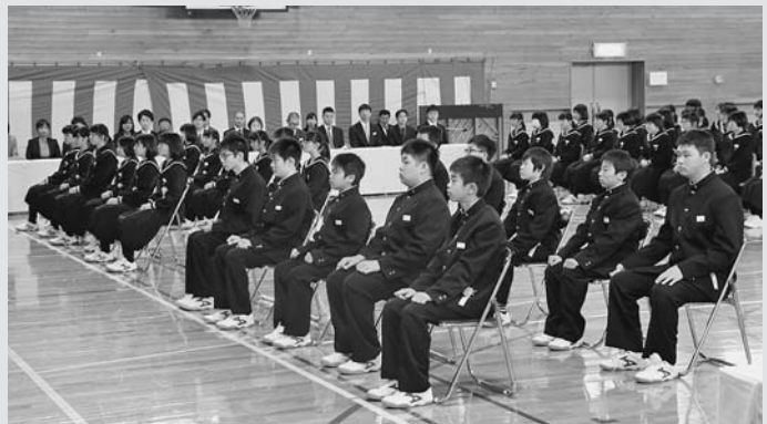
▲増毛中学校入学式では、真新しい学生服に身を包んだ新入学生たちが凛々しい表情で背筋を正し、成長した姿を保護者に披露していました。

4月3日、あつぷる保育所で入所式が行われ、保護者に付き添われた幼児5名が在所児や先生方の歓迎を受けました。また、6日には増毛小学校、増毛中学校それぞれで入学式が、7日には増毛幼稚園で入園式が行われ、新入園児や児童たちは新たなスタートに胸を躍らせている様子でした。 その他にも暑寒大学や町内の女性の学習の場である「さくらコミュニティ学級」で入学・始業式が行われ、春の訪れを感じる町内では、それぞれが新たな第一歩を踏み出しました。