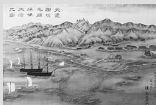
▲「天塩国増毛郡秋味大漁図」