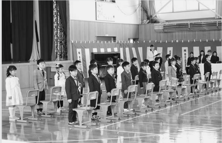
▲増毛小学校では、おしゃれな洋服に身を包み、学校生活に胸を躍らせる22名の新入学児童が、一人一人名前を呼ばれると元気に返事をしていました。

4月3日、あつぷる保育所で入所式が行われ、保護者に付き添われた幼児5名が在所児や先生方の歓迎を受けました。また、6日には増毛小学校、増毛中学校それぞれで入学式が、7日には増毛幼稚園で入園式が行われ、新入園児や児童たちは新たなスタートに胸を躍らせている様子でした。 その他にも暑寒大学や町内の女性の学習の場である「さくらコミュニティ学級」で入学・始業式が行われ、春の訪れを感じる町内では、それぞれが新たな第一歩を踏み出しました。