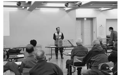
▲ 2月9日に文化センターで行われた「増毛町アライグマ捕獲対策講習会」では、町内から80名を超える参加がありました。