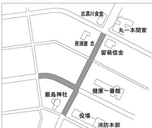
【ロードヒーティング運行期間短縮箇所図】