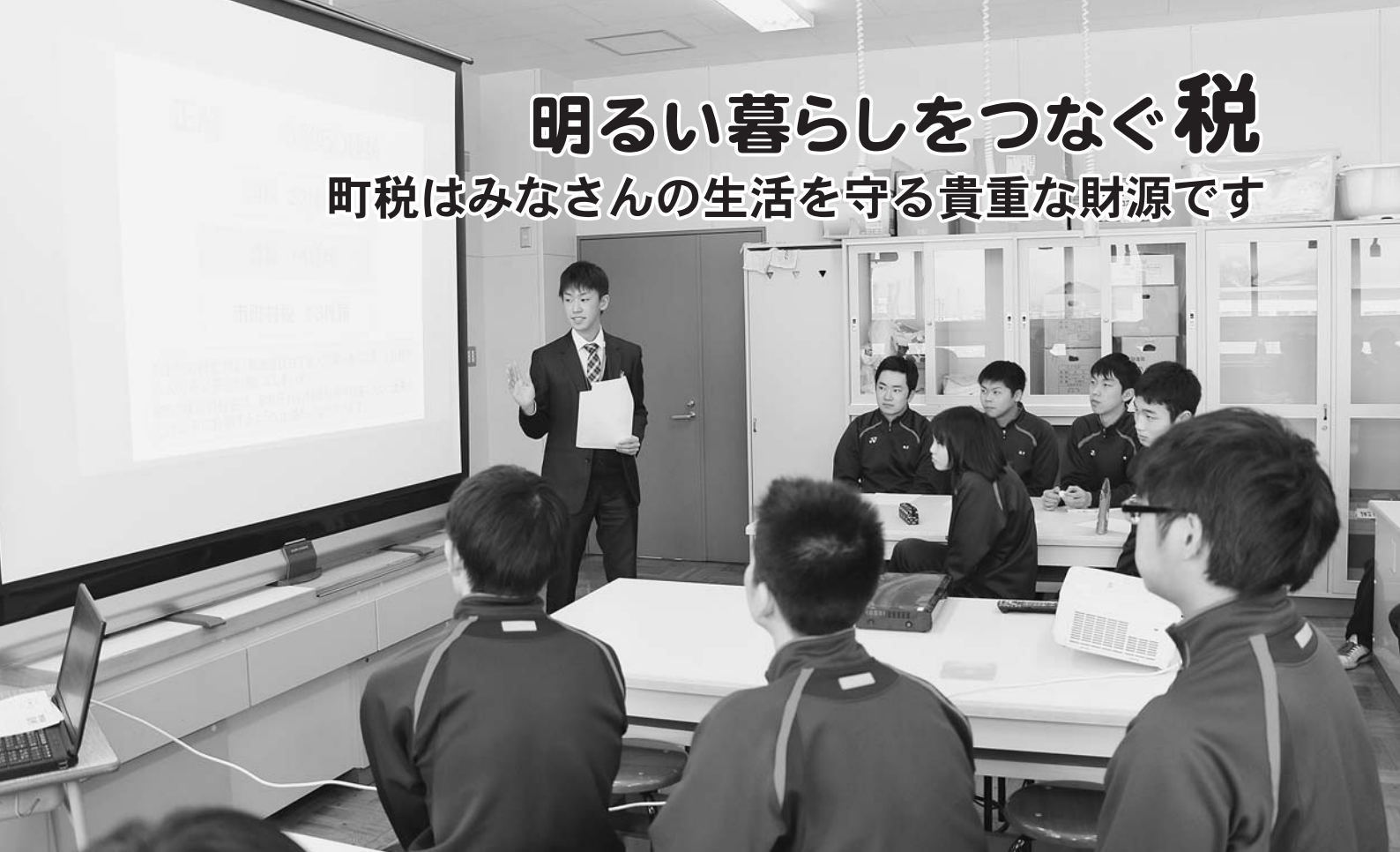
▲写真 昨年行われた租税教室（増毛中）