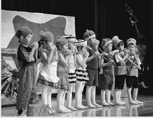
▲増毛幼稚園ひまわり組による劇「さるかに合戦」では、長いセリフもしっかりと覚えて、大人顔負けの演技を披露しました。