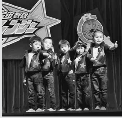
▲増毛幼稚園ばら組男児による遊戯「キュータマダンシング!」では、キレのある踊りで会場を湧かせていました。

10月14日にあつぷる保育所発表会が、11月5日には増毛幼稚園お遊戯会が開催されました。子どもたちはこの日のために練習してきたお遊戯や劇、合唱などを緊張しながらも元気いっぱい披露しました。