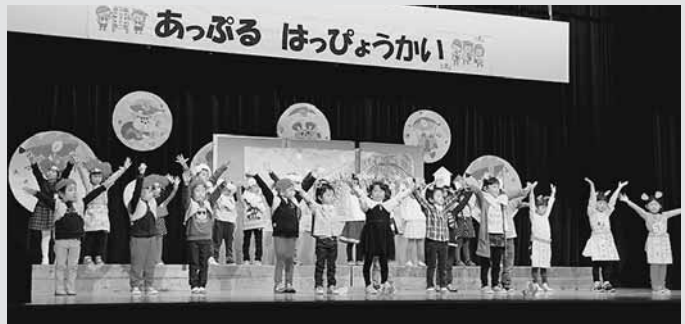
▲あつぷる保育所ぶどう組による劇「ねずみの嫁入り」では、息の合った演技に客席から多くの拍手が送られました。