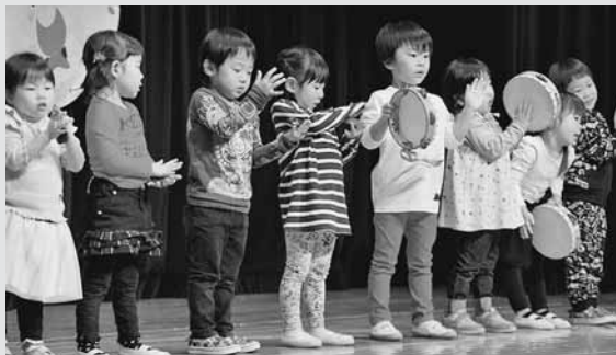
▲あつぷる保育所りんご組全員で「さんぼ」などを元気いっぱいに歌い、上手な楽器演奏も披露しました。