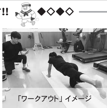
「ワークアウト」イメージ

脳と身体を使い、考えながら骨盤(大腰筋)を動かし歩きます。この機会に美しい歩き方を身につけませんか?腸の活動を促進し、便秘解消やお腹周りのシェイプアップ効果が期待できます。モデルのような正しい身体の使い方を、笑顔で楽しく学んでいきましょう。(屋内グラウンドは室内用シューズが必要です。)