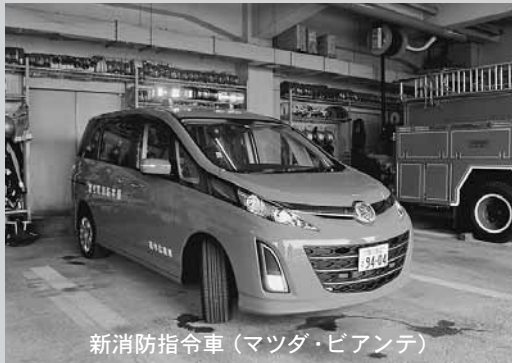
新消防指令車（マツダ・ビアンテ）