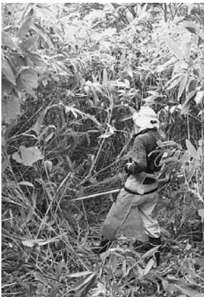
▲悪戦苦闘した笹の伐採作業

また、増毛山道は、昭和40年以降、国土地理院が発行する地図より抹消されていきましたが、増毛山道の会の努力により平成29年2月より再び表示されるに至りました。これは、かつての古道がロマンを超えて現在に蘇ったことを示しています。