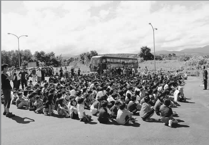
▲増毛幼稚園とあつぶる保育所の幼児、増毛小児童、増毛中学生徒、その他近隣自治会等の住民が見晴駐車帯に避難しました。