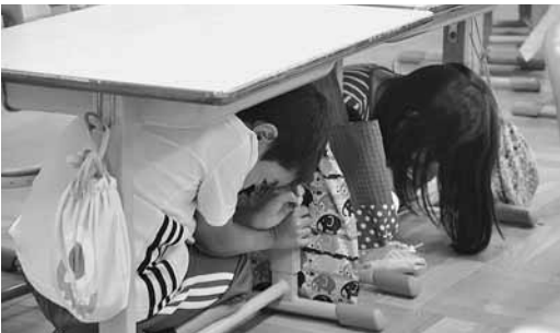
▲地震のときはあわてずにまずは身を守る行動をとりましょう。(シェイクアウト)