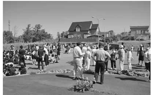
▲▼ 昨年の避難訓練の様子。