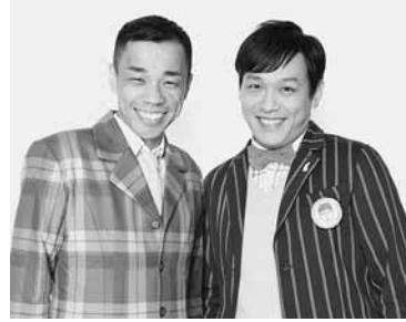
▲“あたりまえ体操”でおなじみの「COWCOW」

おります。この機会にテレビに出演しているお笑い芸人を生で見えて、「笑いの秋」にしてはいかがでしょうか。