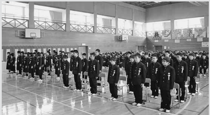
▲増毛中学校入学式では、真新しい学生服に身を包んだ新入学生たちが凛々しい表情で背筋を正して整列し、成長した姿を保護者に披露していました。

その他にも暑寒大学や町内の女性の学習の場である「さくらコミュニティ学級」で入学・始業式が行われ、春の訪れを感じる町内では、それぞれが新たな第一歩を踏み出しました。