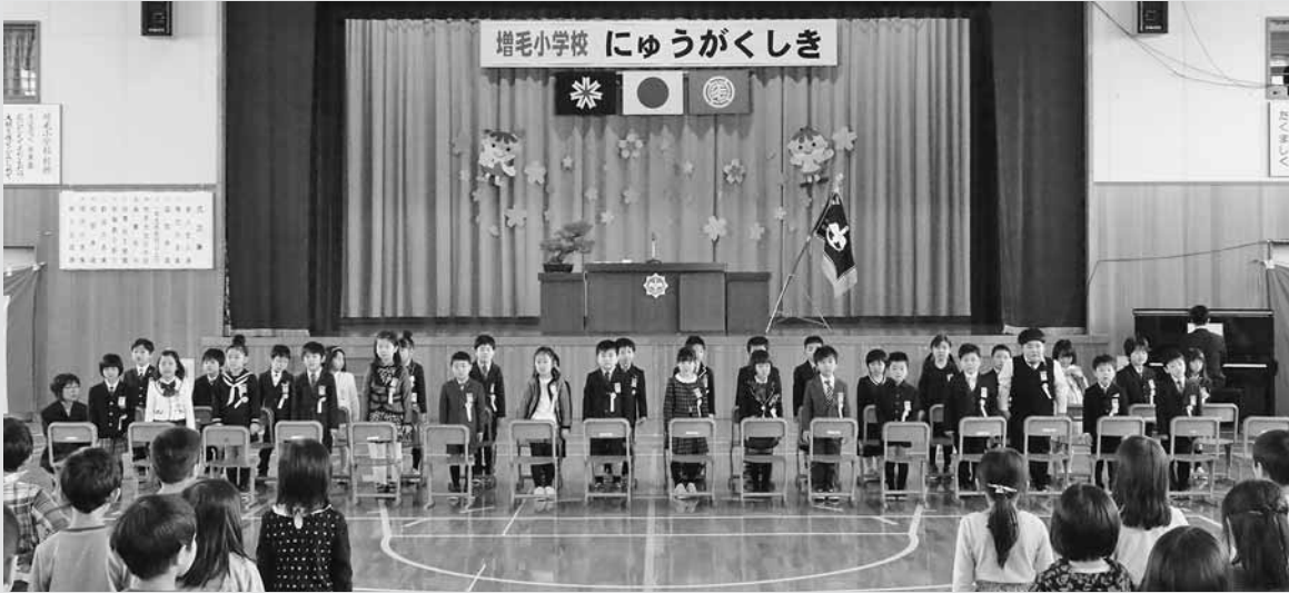
▲増毛小学校では、おしゃれな洋服に身を包み、学校生活に胸を躍らせる36名の新入学児童が、一人一人名前を呼ばれると元気に返事をしていました。

4月4日、あつがる保育所で入所式が行われ、保護者に付き添われた幼児11名が在所児や先生方の歓迎を受けました。また、6日には増毛小学校、増毛中学校それぞれで入学式が、7日には増毛幼稚園で入園式が行われ、新入園児や児童たちは新たなスタートに胸を躍らせている様子でした。