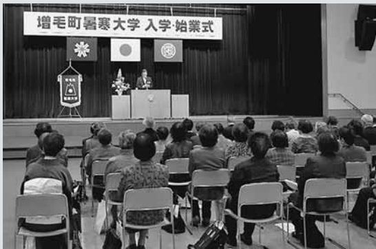
▶暑寒大学では3名、さくらコミュニティ学級では5名の新入学生を迎え、充実した学習に取り組むことを誓いました。