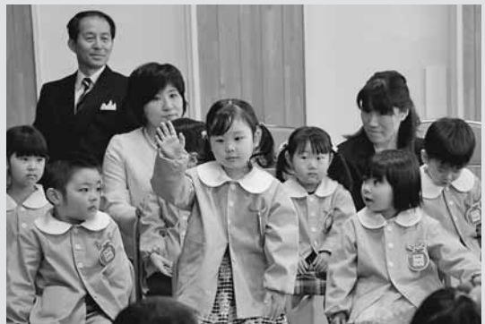
▶名前を呼ばれ、元気に返事をする増毛幼稚園新入園児（写真上）とあつがる保育所新入所児（写真下）