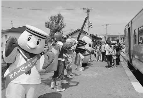
◀臨時列車をマシーンをはじめとしたゆるキャラたちでお出迎え