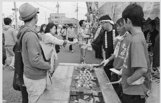
▲漁組青年部が提供した焼きタコや焼きぼたんえびが大人気