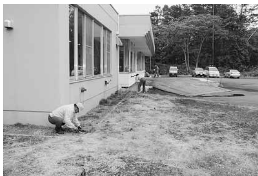
▲ましけ葬苑周辺の草取りと、外側の窓も磨きました