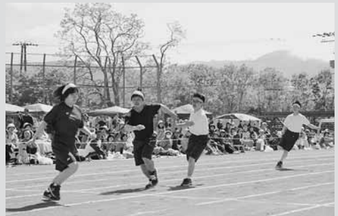
▲気持ちでバトンをつなぐ全員リレー