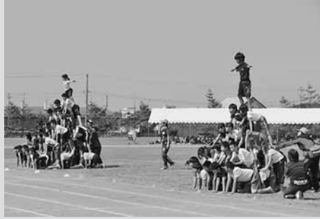
▲見事な五段タワーで魅せた組体操