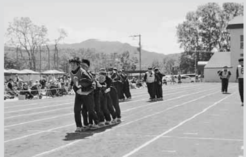
▲増中体育祭名物！ムカデ競争