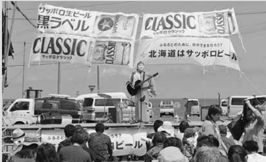
▲もちろん今年も来ましたインディ「えびの唄 大好きましけ」を熱唱！