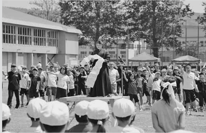
▲紅白両チームが、気合いの入った応援合戦を繰り広げました