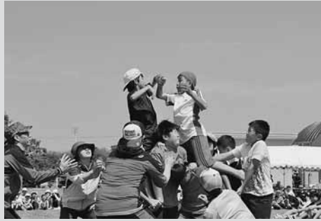
▲闘志あふれる騎馬戦での戦い