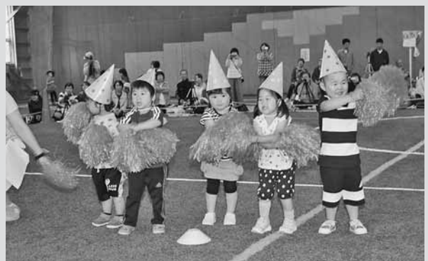
▲「ぼよん行進曲」で元気いっぱいにお遊戯を披露