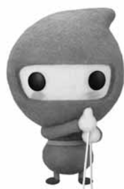
高齢者向け 給付金キャラクター 「カクニンジャ」

4月中旬に「年金生活者等支援臨時福祉給付金」の申請書が届いた方は、下記の要件に当てはまる場合、該当になると思われますので、まだ申請がお済みでない方は、期限までに申請手続きにお越し下さい。