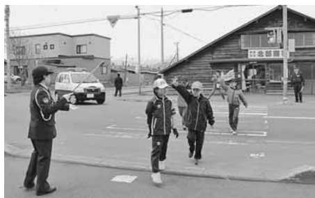
▲増毛小学校児童への交通安全教室の様子