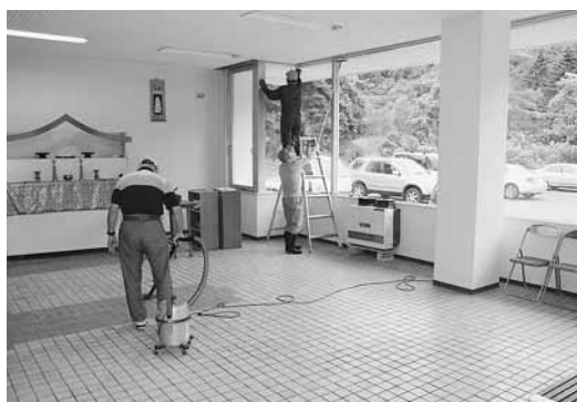
▲収骨室のタイル、窓ガラスをピカピカに