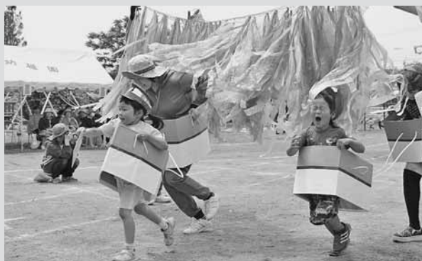
▲「電車でレッツゴー」では、親子で電車に乗り込み、息を合わせてゴールを目指しました