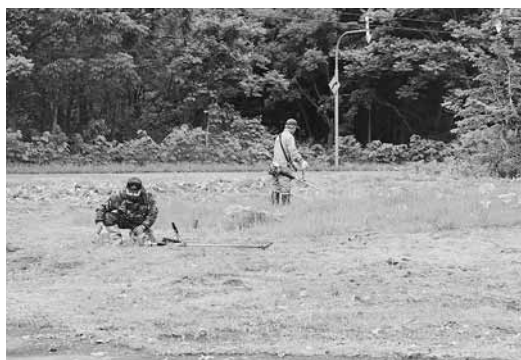
▲ましけ葬苑のまわりは山なので、生い茂った雑草を刈るのは大変