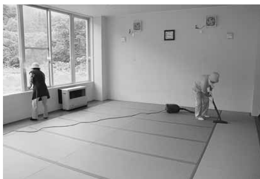
▲新しい畳の香りを感じながら、丁寧に掃除

ましけ葬苑は、昭和53年に建てられ、稼働後38年を経過していますが、最近では平成24年にトイレを簡易水洗の洋式便器に改装、25年には2つある火葬炉のうち1つを取り替え、26年には内装のクロス張り替えと床のタイルの補修を、27年にはもう一つの火葬炉を取り替えさらに収骨室の天井塗装、待合室のクッションフロアの張り替えを行いました。そして今年待合室の畳をすべて新しくし、清潔で良好な状態で町民の皆さんが利用できる様になっています。