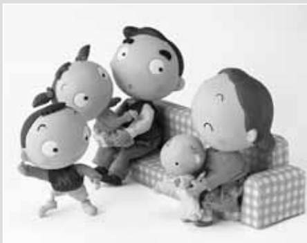
町民課保険年金係 （電話 53-1113）

※対象となる方につきましては、町のホームページをご覧頂るか、役場保険年金係へお問い合わせ下さい。 （申請の期限は診療を受けた次の月から1年以内です。） 窓口にへお越し下さい。