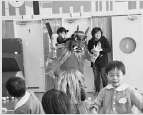
▲迫力のある鬼に紅白の玉を投げながら必死で逃げる園児たち（増毛幼稚園）

2月3日の節分の日、増毛幼稚園では「節分の集い」が、あつぶる保育所では「親子遊び広場」と「節分の集い」がそれぞれ開かれました。登場した鬼に泣き出す子もいましたが「鬼は外！福は内！」と元気に叫びながら紅白の玉を投げて鬼を見事追い払い、その後は拾った豆やお菓子を仲良く食べて節分を楽しみました。