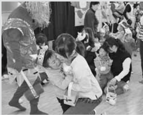
▲太鼓の音とともに登場した鬼に泣き出してしまった子どもたち（あつぶる保育所）