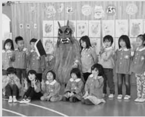
▲最後は鬼と和解し、記念撮影。泣いていた子も笑顔でピース！（増毛幼稚園）