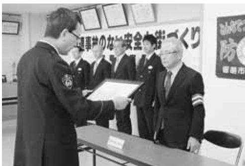
◀ 代表して感謝状を受けとる増毛町交通安全協会の三上会長