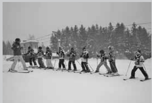
▲熱心に練習に励む参加児童たちの様子

教室期間中は天候の悪い日が多く、時折吹雪の中での練習になりましたが、参加した児童たちは、寒さに負けることなく元気に練習に励んでいました。