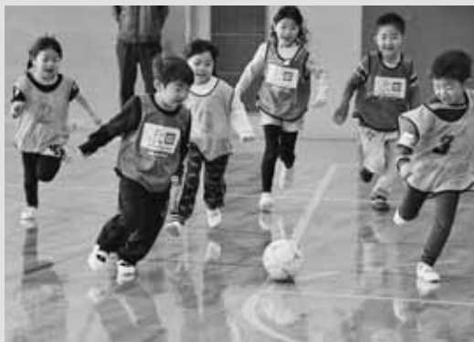
▲仲良くボールを追いかけながら交流を深める幼児

4月から小学1年生になる増毛幼稚園とあつぷる保育所の幼児を対象に、幼保合同保育交流会が1月22日、町立体育館で行われました。