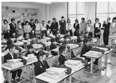
▲平成27年度の新一年生増毛小入学の様子

増毛町の暑寒別岳をはじめとする自然の素晴らしさ、そしてなにより人の温かさに触れ、自分の理想の暮らしが出来る条件が整っていて、とても魅力を感じました。増毛町の自然の可能性を発信し、本当の“豊かさ”とは何なのかを追求しながら、皆さんと一緒に増毛町のさらなる魅力を引き出していきたいと思っていますので、よろしくお願いいたします。