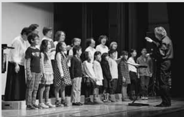
▲暑寒コーラスの発表では、松本ピアノ教室の生徒も参加し、息の合った歌声を披露

大正琴、コーラス、カラオケ、フラダンスやウインドアンサンブルなど各団体が日頃の練習の成果を披露すると、観覧に訪れた町民約200名から、声援とともに大きな拍手が送られていました。