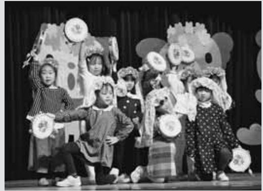
▲お遊戯「ハンガリーの幻想」で女の子らしい素敵な踊りを披露したぶどう組女児