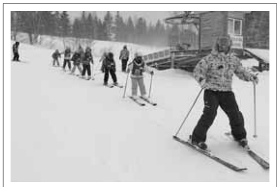
昨年のジュニアスキー教室の様子