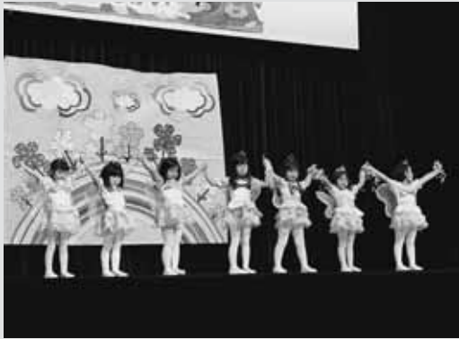
▲花の妖精になりきってキュートにお遊戯「ハッピーラッキー☆ゴー！」を踊ったばら組女児