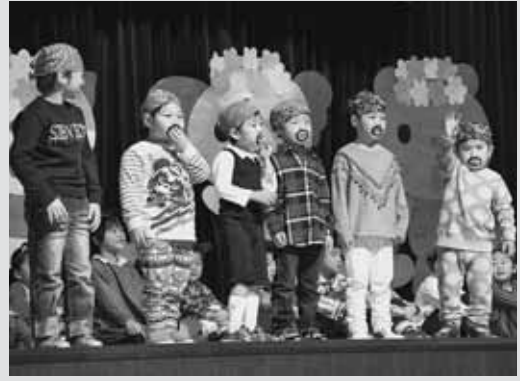
▲劇「ブレーメンの音楽隊」で練習の成果を発表したぶどう組