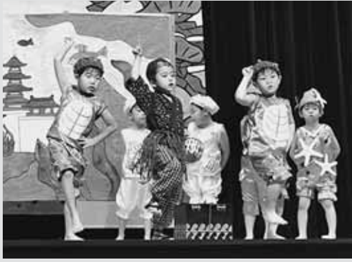
▲「うらしま たろう ザ・ミュージカル」を、セリフも踊りも元気いっぱい演技したひまわり組