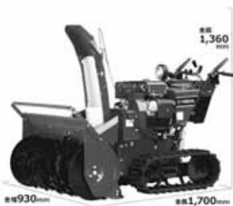
貸出機種：ヤマハYT-1390E X R