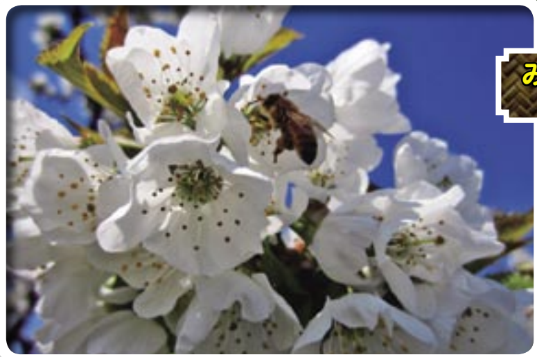
みつばちによる受粉 (果樹園)