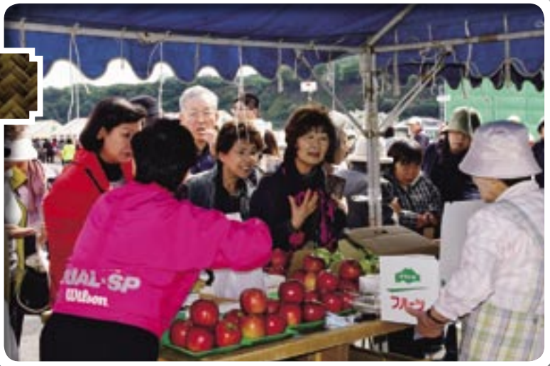
味覚のイベント 秋味まつり(増毛港)