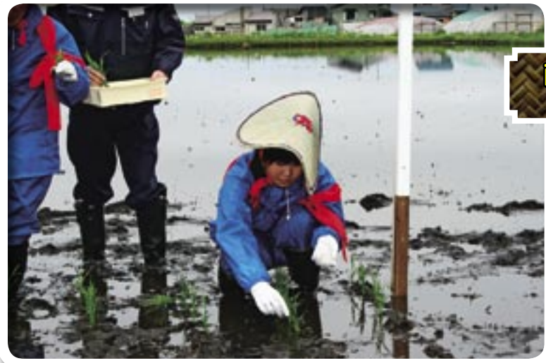
献上米お田植え祭 (平成21年)