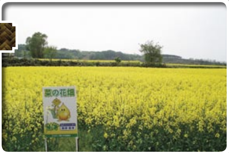
黄色の春を呼ぶ 菜の花(なたね畑)